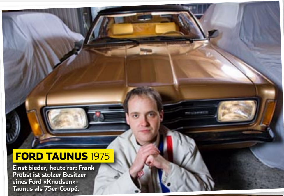
FORD TAUNUS 1975